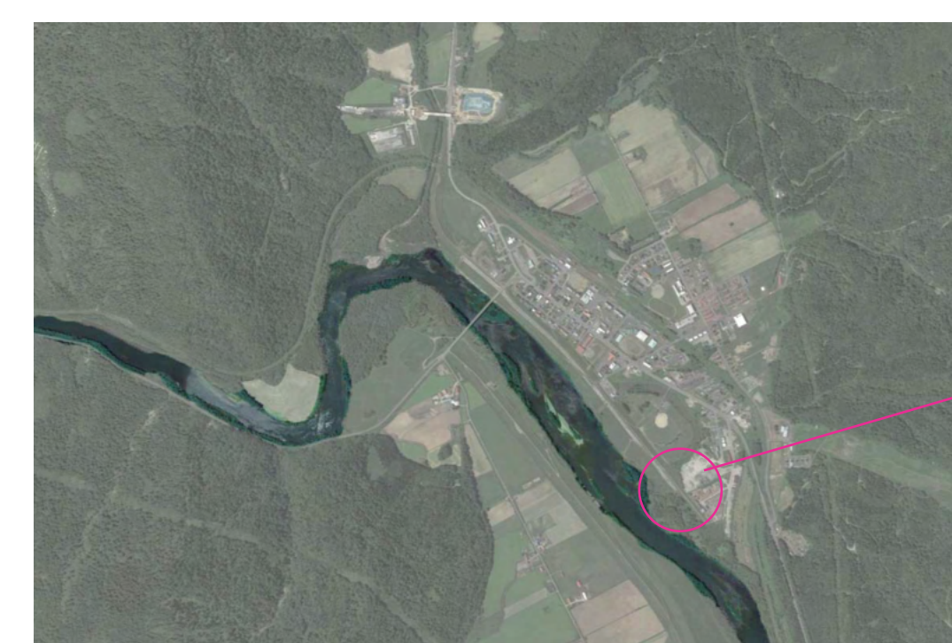
舞踊 × 川 対象敷地