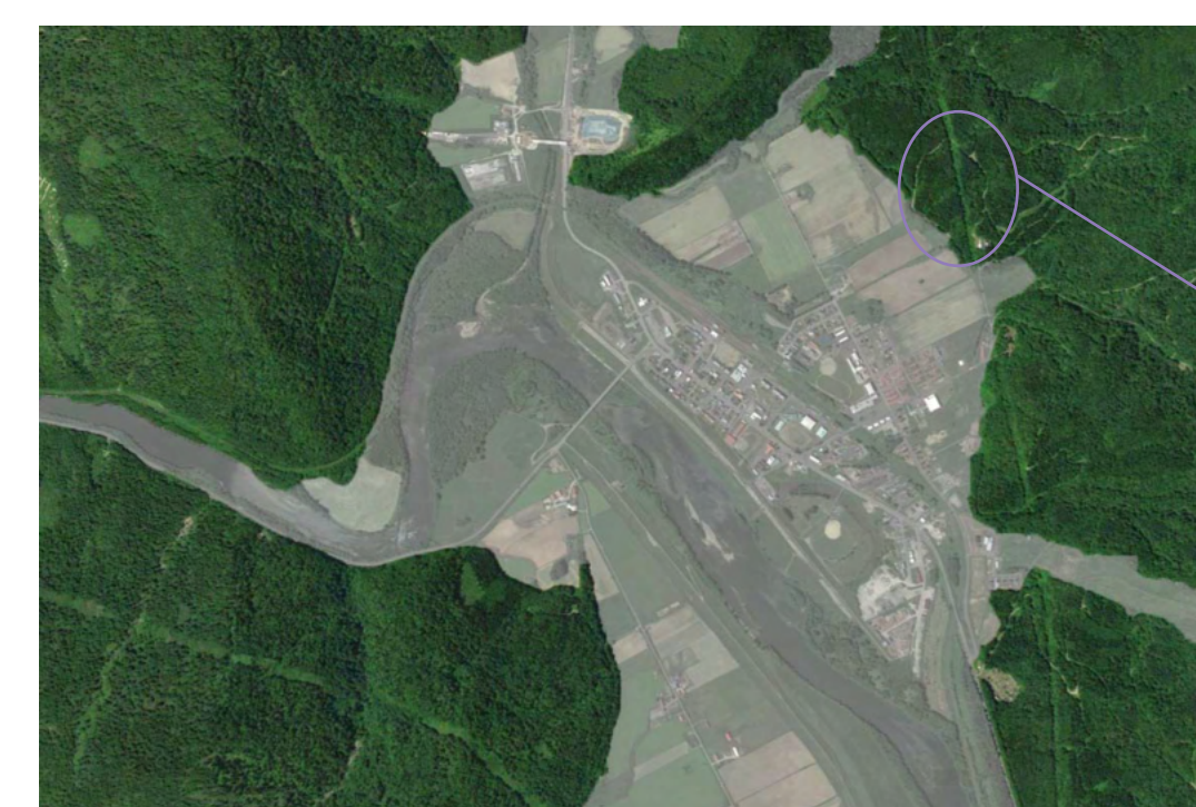
音楽 × 森 対象敷地