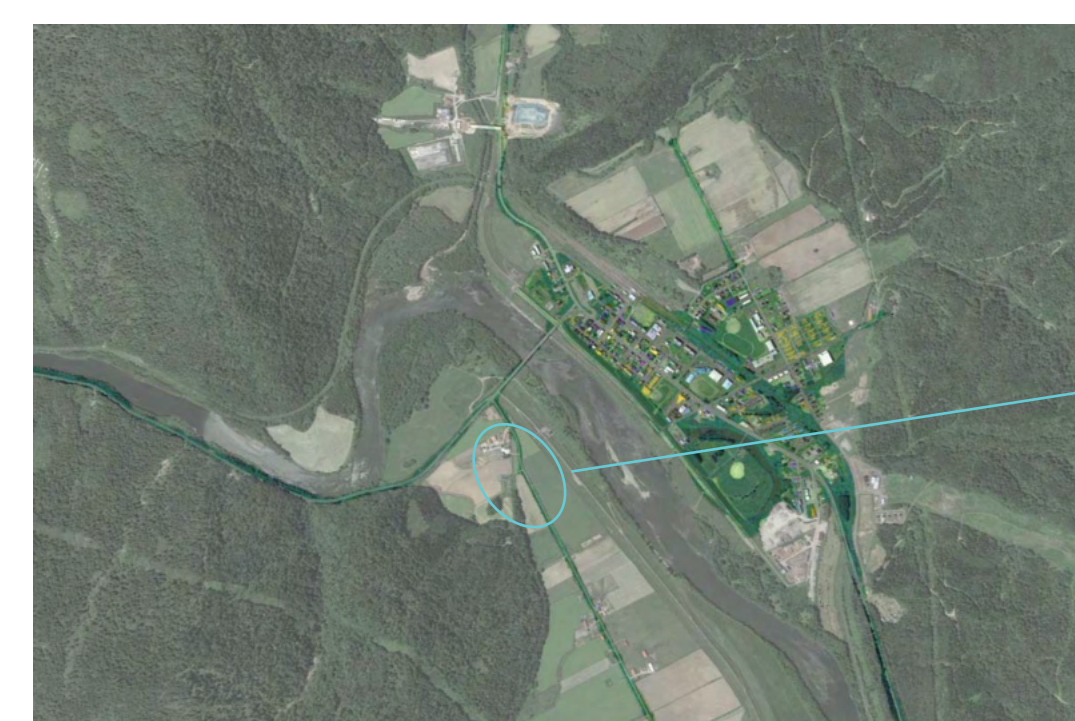
詩 × 道 対象敷地