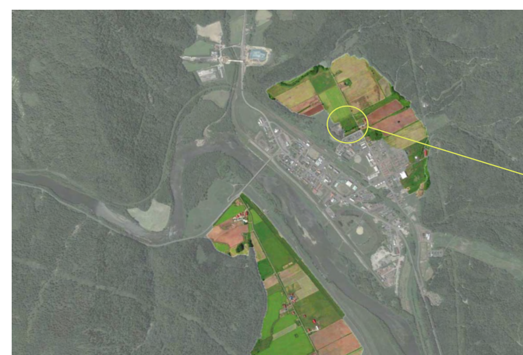
絵画 × 平野 対象敷地