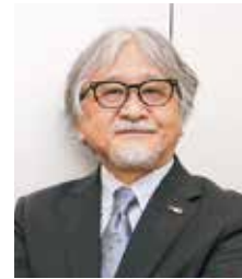
長岡造形大学 学長 馬場 省吾

これら卒業・修了生の研究成果を多くの方々に御覧いただければ幸いです。学生・教職員一同お待ちしております。