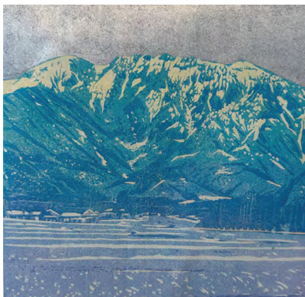
八海山 / 2023