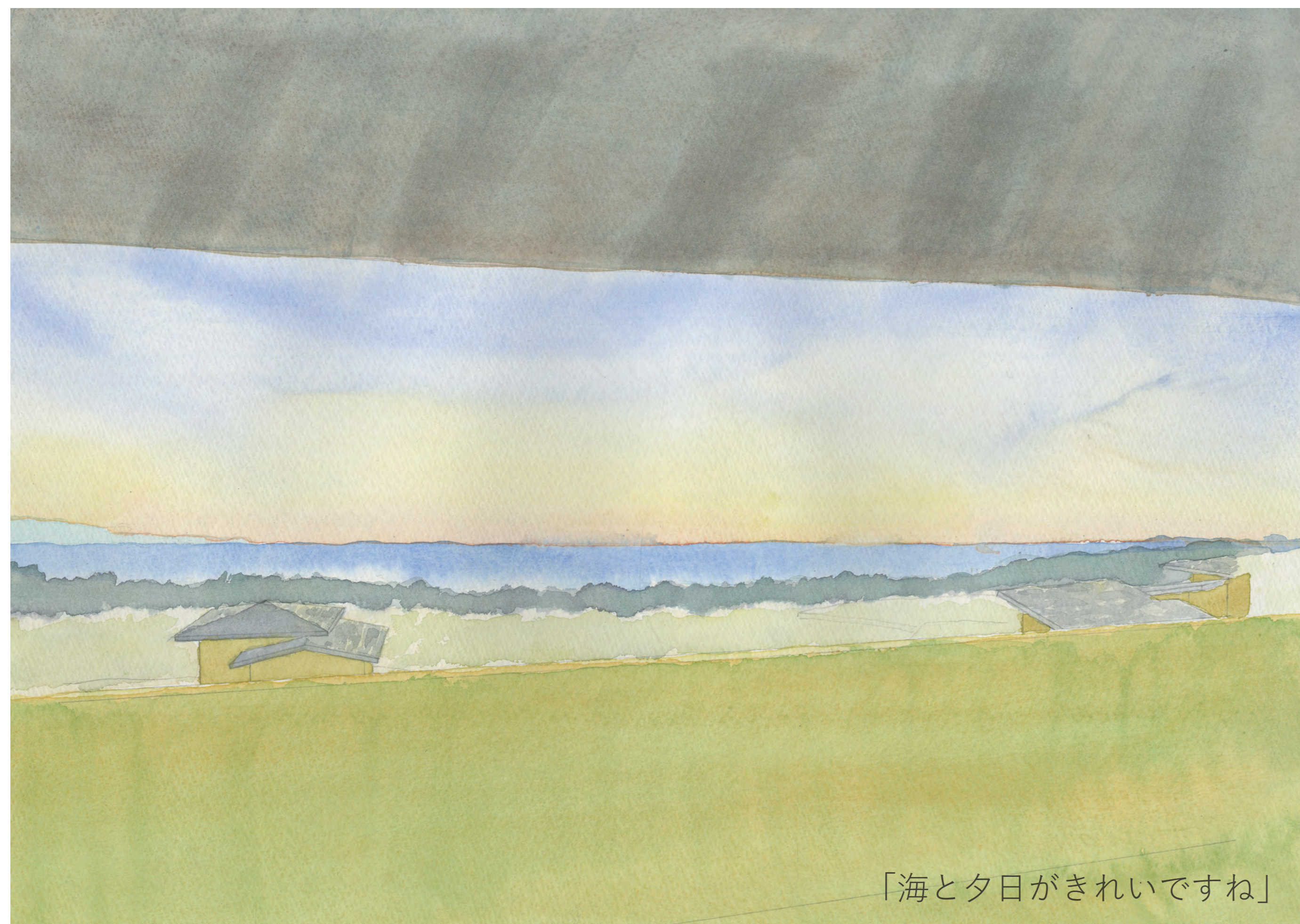
「海と夕日がきれいですね」