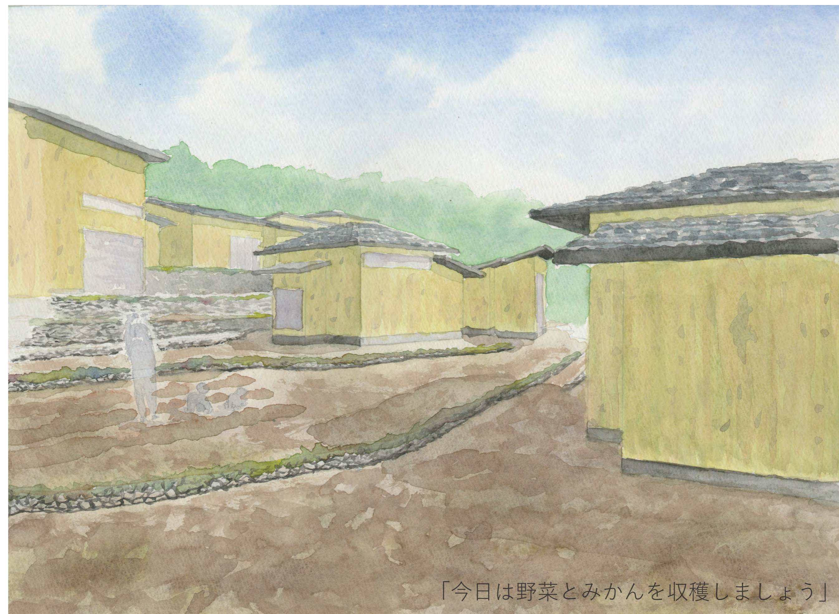
「今日は野菜とみかんを収穫しましょう」