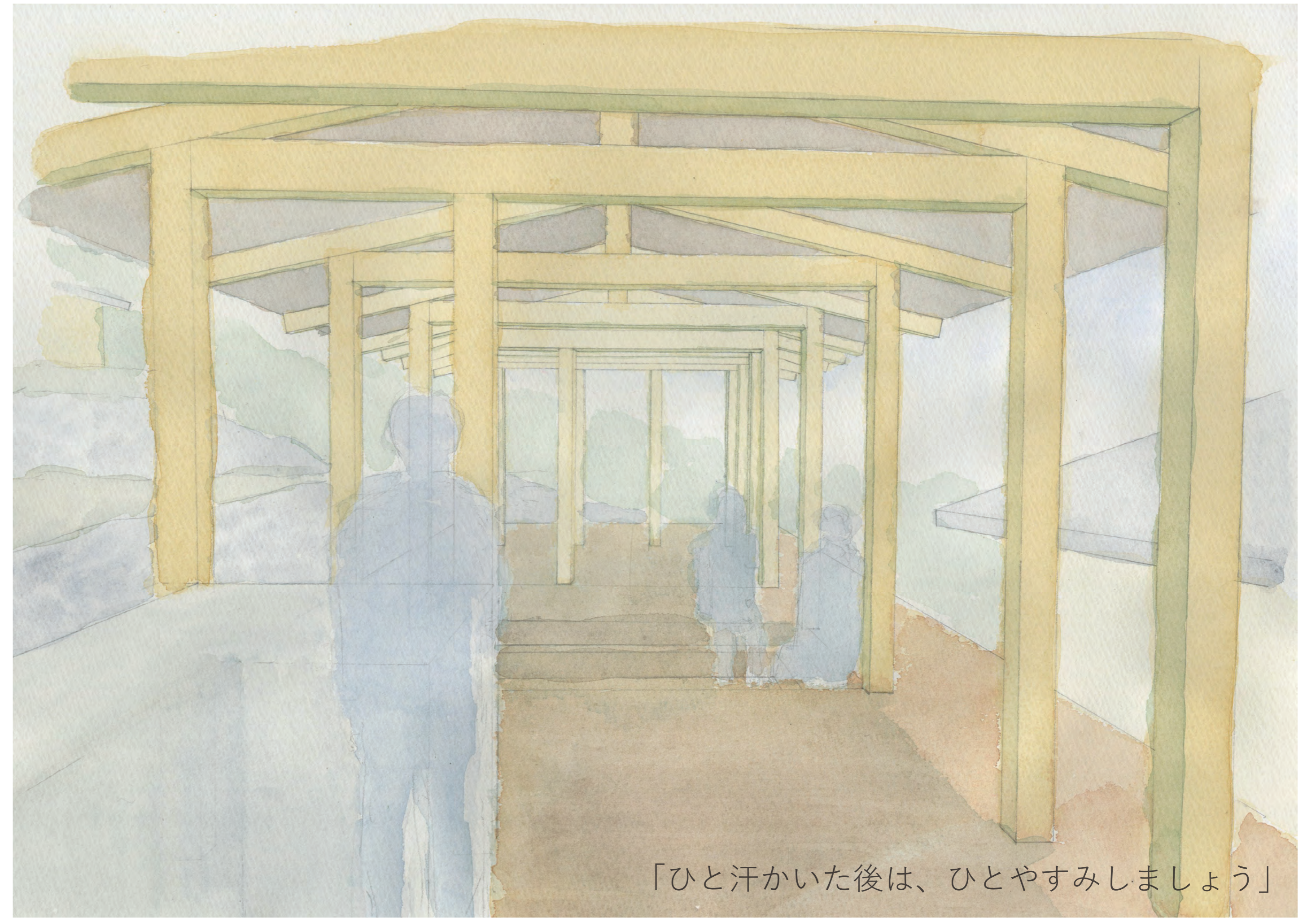
「ひと汗かいた後は、ひとやすみしましょう」