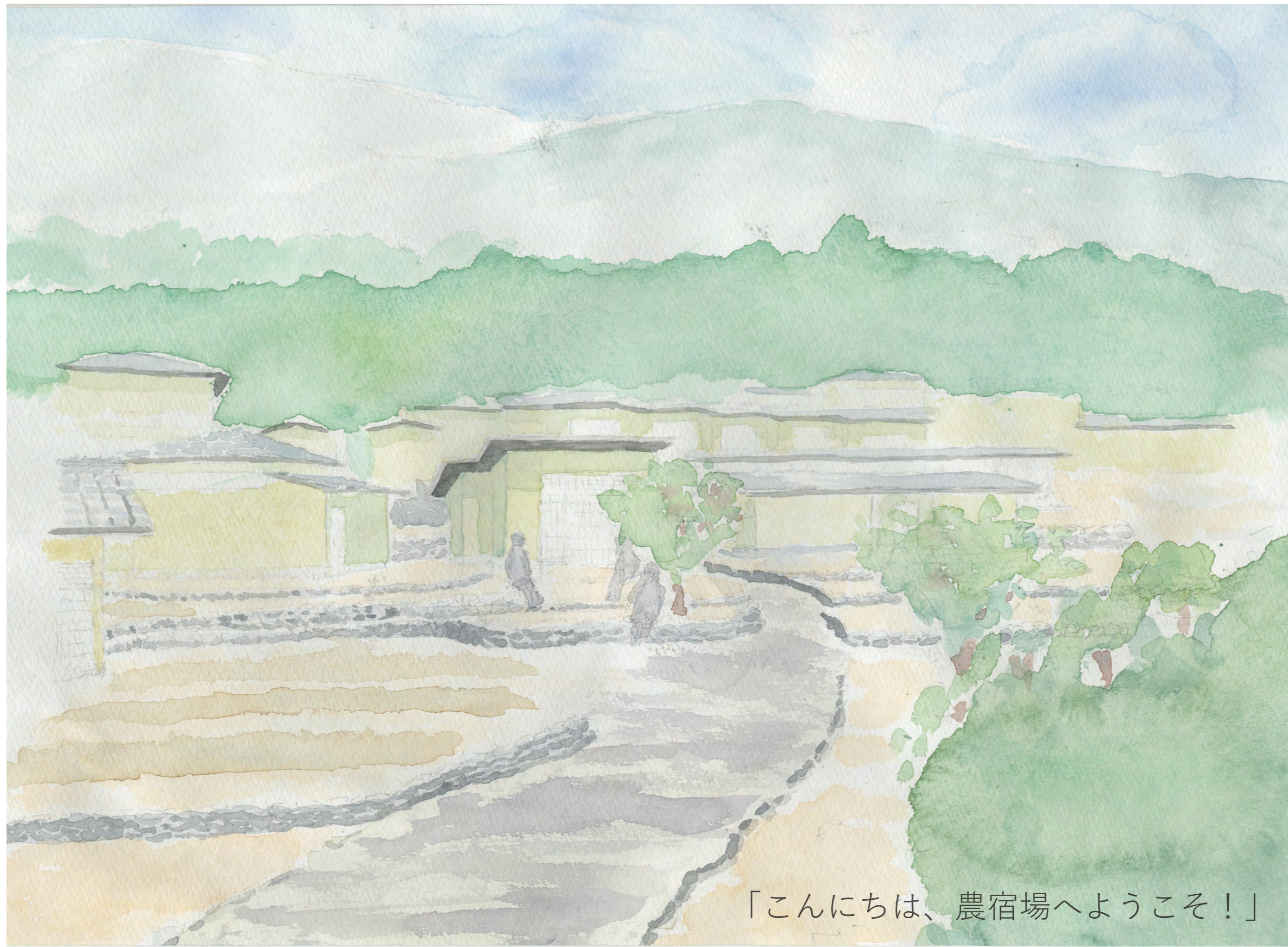
「こんにちは、農宿場へようこそ！」